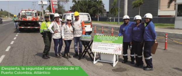
¡Despierta, la seguridad vial depende de ti! Puerto Colombia, Atlántico

Las campañas fueron realizadas en el corredor a cargo del Concesionario, UF4: Vía al Mar entre Puerto Colombia y Barranquilla y UF1: Entre el Anillo vial de Crespo y La Boquilla, en Cartagena. Para el desarrollo de estas actividades, Concesión Costera en compañía de la Policía de Carreteras entrega material informativo alusivo a los usuarios de la vía.