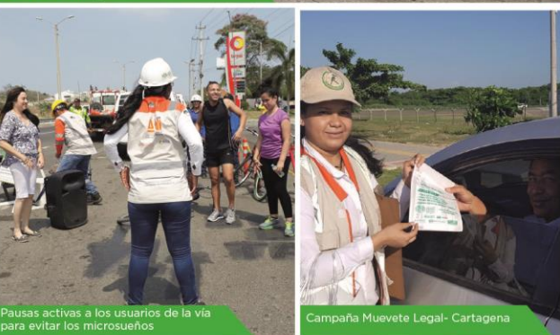
Pausas activas a los usuarios de la vía para evitar los microsueños